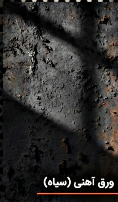
ورق آهنی (سیاه)

عرضه محصولات در طیف وسیعی از آلیاژها متناسب با محیط پروژه